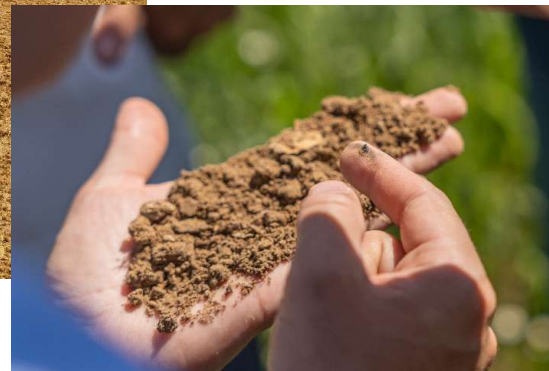
Projekt 2024: Klimaneutraler Anbau.

Unsere Auswahl des Saatgutes fiel auf die Sorte MAX. Hier orientierten wir uns nach den Landessortenversuchen. Unsere Kriterien für die Auswahl: