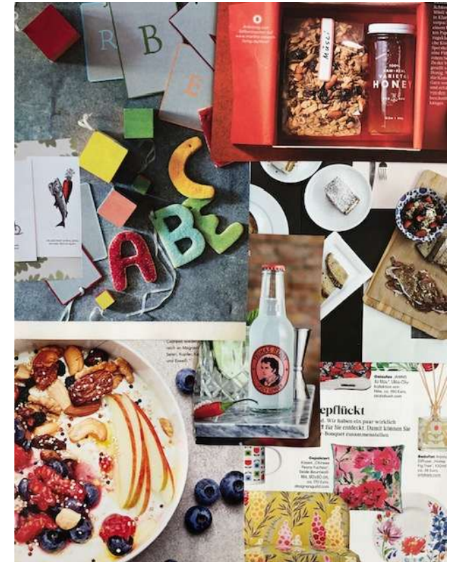
Produkt- und Markenentwicklung, 2020