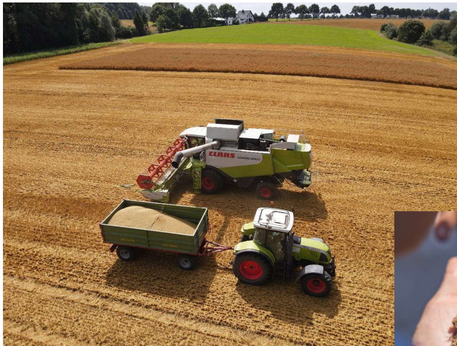
Erste Ernte, Anfang August 2020