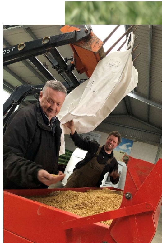
Erste Einsaat, März 2020