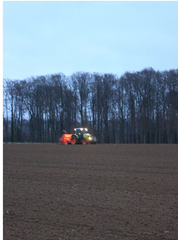
Erste Einsaat, März 2020