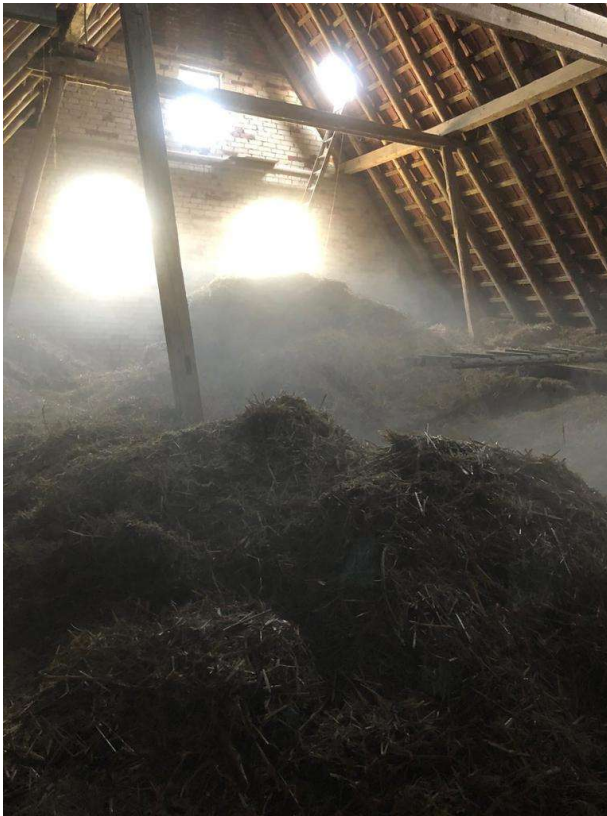
Deele, vor Umbau 2019